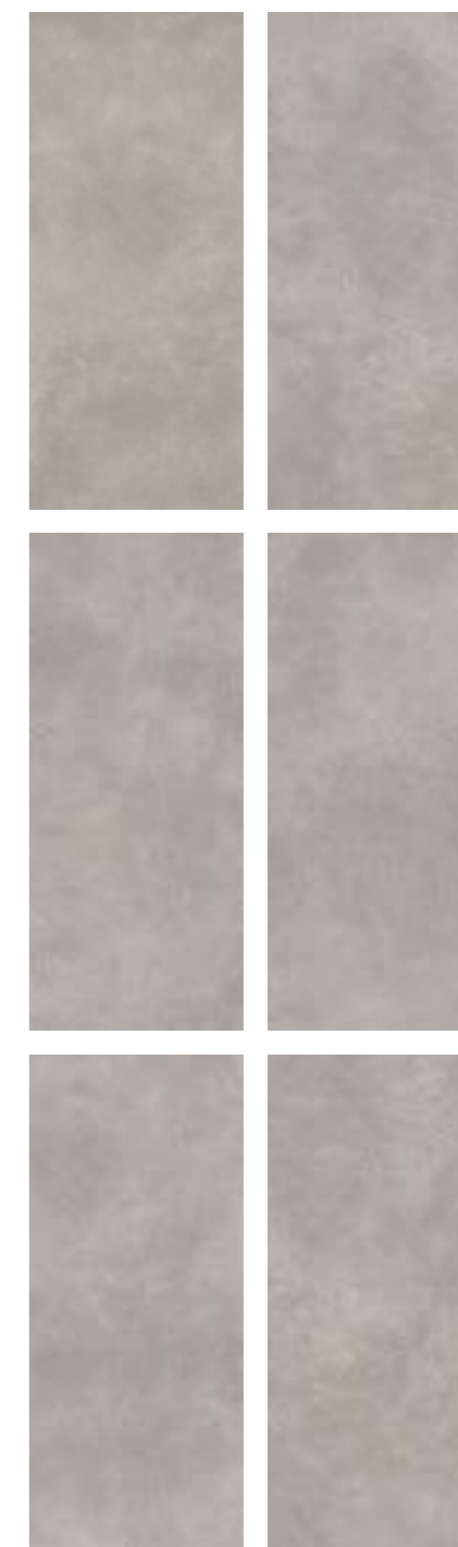
Concrete Effect variations 120x278

R7GM 120x278 Rett R6SJ 120x240 Rett R6SN 120x120 Rett