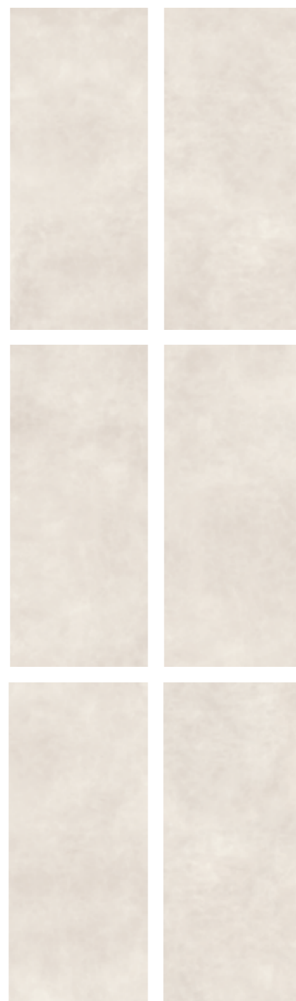
Concrete Effect variations 120x278

R7GL 120x278 Rett R6SH 120x240 Rett R6SM 120x120 Rett