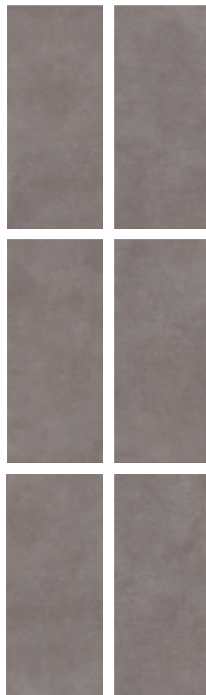
Concrete Effect variations 120x278

R7GN 120x278 Rett R6SK 120x240 Rett R6SP 120x120 Rett