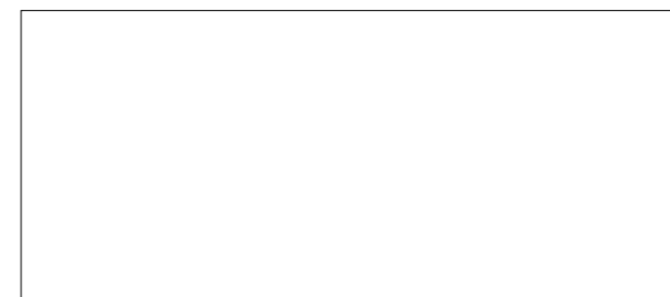
120x278 cm 47 1/4 "x109 7/16 " ± 6 mm