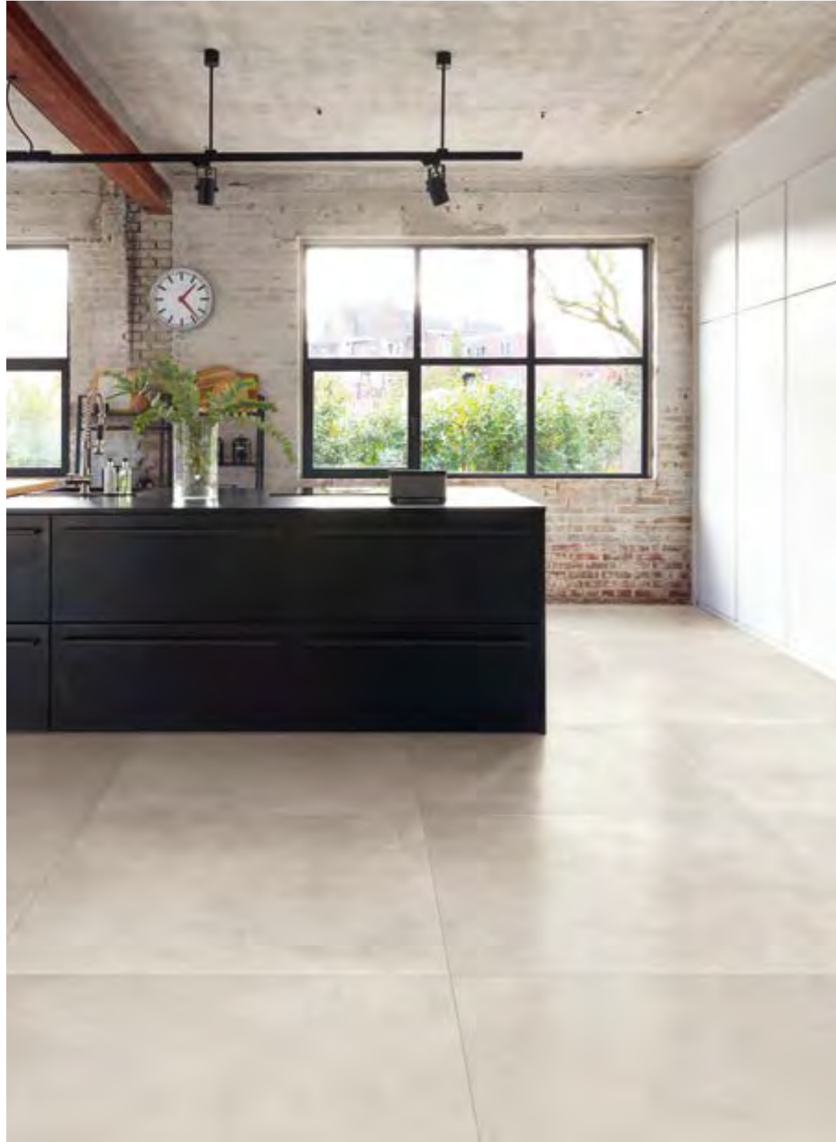
R65M Bianco Rettificato 120x120 - 47 1/4 "x47 1/4 "